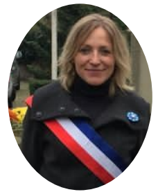
Votre maire Murielle Fabre

De jolies couleurs orangées parent notre village, agrémentées par les décorations éphémères qui ponctuent désormais nos saisons pour notre plus grand plaisir. Cette revue, plus courte, accompagne l'édition spéciale des 125 ans de la Mairie, qui sera l'évènement phare de ce mois-ci. Mais ceci ne résume, loin s'en faut, l'activité de l'équipe municipale. Notre dernier conseil municipal se tiendra le 30 novembre, et avec lui les dernières délibérations de 2021. Des réunions axées sur la prévention vous sont également proposées, comme la présentation du dispositif de « participation citoyenne » - pour vous associer à la protection de notre environnement, en voisin vigilant, en lien avec la gendarmerie, comme nous nous y étions engagés.