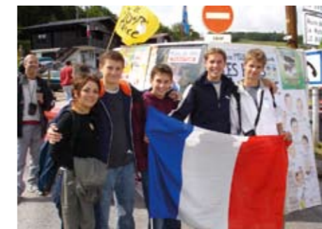
Tour de France

Dès début 2006, ouverture 1 dimanche par mois (sur proposition des jeunes) ■