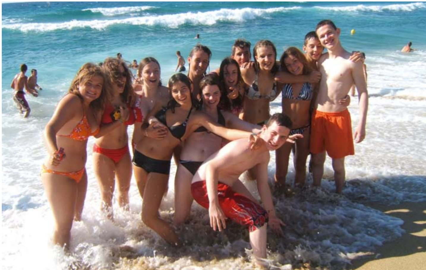
Séjour en Corse