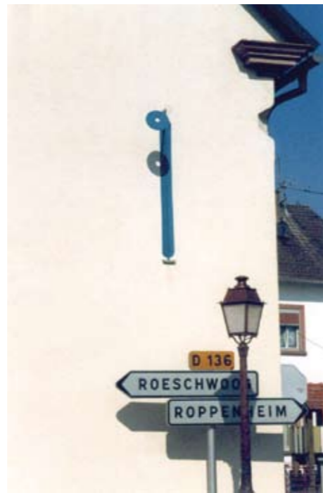
La « MERIDIENNE » sur l'église de Neuhaeusel. Elle va indiquer l'instant du MIDI vrai dans peu de temps.