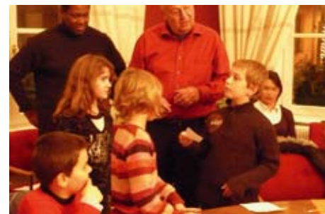
le suspense du dépouillement

pour 4 ou 5 places à pourvoir suivant les classes il y a eu 8 ou 9 candidats ou candidates. Le nombre de candidat(e)s des collèges était lui en ligne avec le nombre de places. L'engagement équilibré des filles et des garçons est un bon exemple.