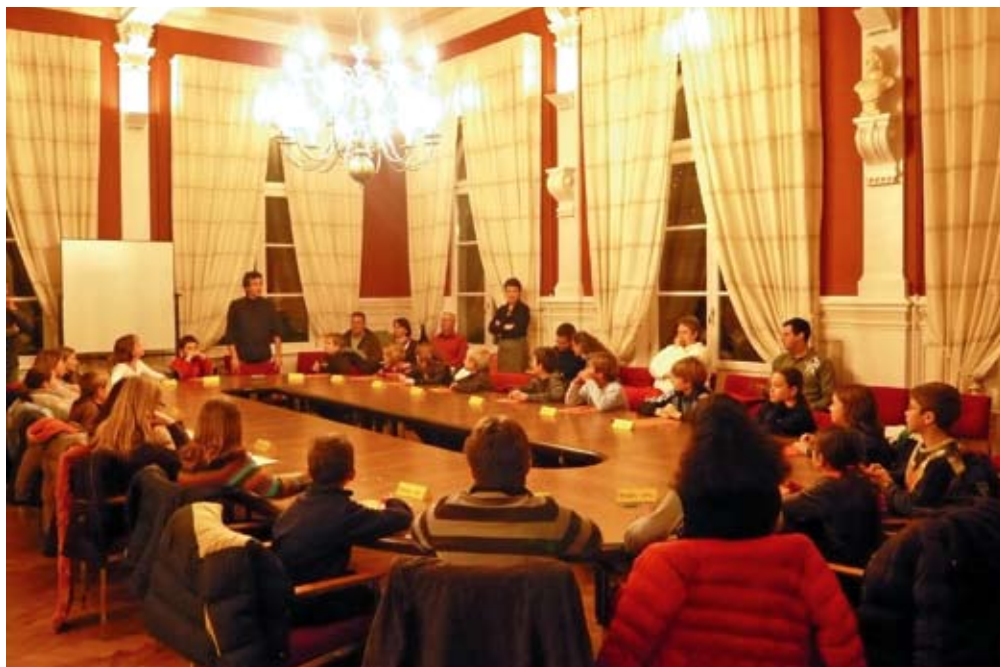
A la salle du conseil, on siège comme des grands

L'information a ensuite été communiquée aux enseignants et aux