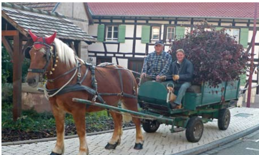
Notre attelage hippomobile collecte verre, papier et déchets verts à recycler chez les personnes âgées du village. Il suffit de s'inscrire en mairie.

La collecte et le traitement des déchets sont des services de proximité dont la CUS assure la tâche, contribuant à la qualité du cadre de vie de la population de chaque commune membre.