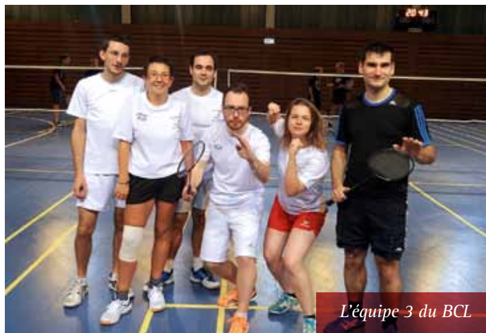
L'équipe 3 du BCL

Bonnes fêtes de fin d'année. L'équipe du BCL