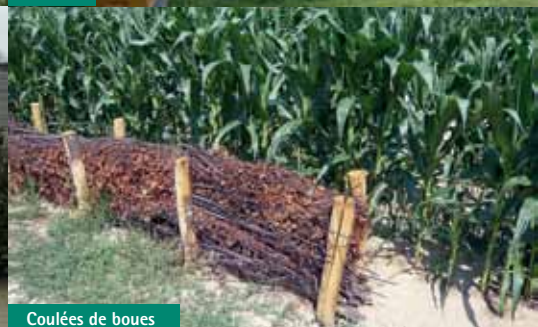
Coulées de boues