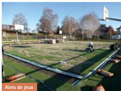
Aires de jeux