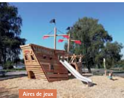
Aires de jeux